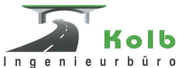
..... Helmut Kolb

Ingenieurbüro Helmut Kolb Zepelinstraße 10 89555 Steinheim am Albuch Telefon: 073 29 - 92 03 - 0 Telefax: 073 29 - 92 03 - 29